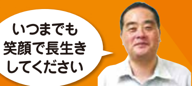
いつまでも 笑顔で長生き してください

■主催 / 愛媛銀行 NPO えひめライフサポート協会 ■後援 / 愛媛県 愛媛県教育委員会 松山市 愛媛県警察 愛媛県社会福祉協議会 愛媛県木材協会 愛媛県身体障害者団体連合会 愛媛県視覚障害者協会 愛媛県中小建築業協会 愛媛新聞社 えひめリビング新聞社 南海放送 愛媛県社会福祉事業団(敬称略:順不同) ■協力 / 四国八十八ヶ所霊場会 ■協賛 / マレーシア政府観光局 ■連絡先 / NPO えひめライフサポート協会 事務局 えひめライフサポート協会 検索 (株)相中組 伊予市下吾川2045-1 TEL/089-983-1255または070-5355-3140 協会会長/澤村