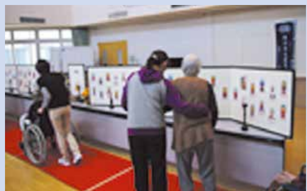
※写真はイメージです

巡礼体験された方にはお一人様一つ「お砂踏み御守」を授与致します ※ただし御守は数に限りがございますので無くなり次第終了致します